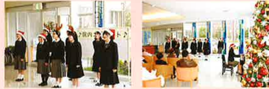
第12回（H22年12月11日開催） 「中村学園女子高等学校コーラス部」