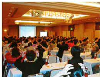
頭皮マッサージ実践中の様子