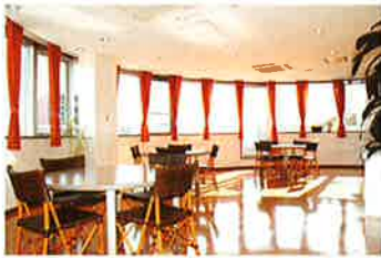
ダイニングルーム