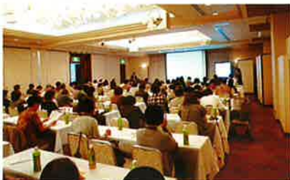
講演中の会場の様子