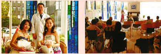
第11回（H22年6月19日開催） 「ピアノ伴奏によるソプラノ歌唱」

今後も院内コンサートを計画しています。ぜひ多くの方にご参加いただきたいと思います。